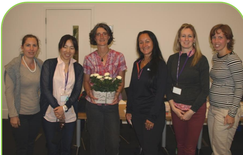
Az oxfordi "csapat"